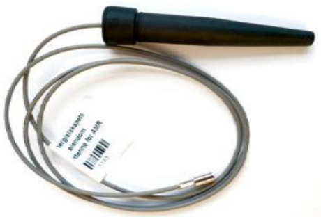
Figur 3 (innstikkantenne)

Installeres inn i vegg el ut av skap i friluft. Plasseres helst opp, men kan også plasseres i underkant skap. Antennen plasseres i utsparring på 16mm. Antennen må festes vertikalt på skapet.