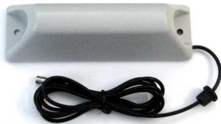
Figur 5 (veggantenne)